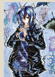
「Grape after rain.」